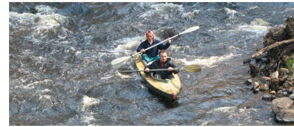
Весной некоторые белорусские реки могут бросить вызов даже опытным туристам-водникам