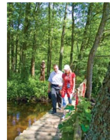
Национальные парки предлагают ряд интересных пеших маршрутов