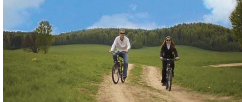
Велотурзм набирает популярность

Романтиков и мечтателей привлечет конный поход, для которого достаточно иметь начальные навыки обращения с лошастью. Плавно покачиваясь в седле, так легко представить себя в далеком прошлом с его отважными рыцарями и прекрасными дамами. Конные туры