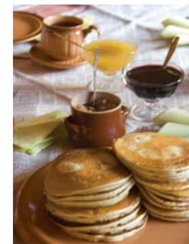
Вкусная и экологически чистая еда — неотъемлемый атрибут сельской жизни

Если же вы не поклонник феерических шоу и шумных праздников, займитесь фотоохотой на лоне тихой белорусской природы. Маленький, шаловливый ручеек и широкая речка с державным и медленным течением, стрекоза, присевшая на тонкую травинку и лошади, пасущиеся на зеленых холмах — все может попасть в объектив фотоаппарата, а удачные кадры еще долго будут радовать душу и согревать воспоминаниями.