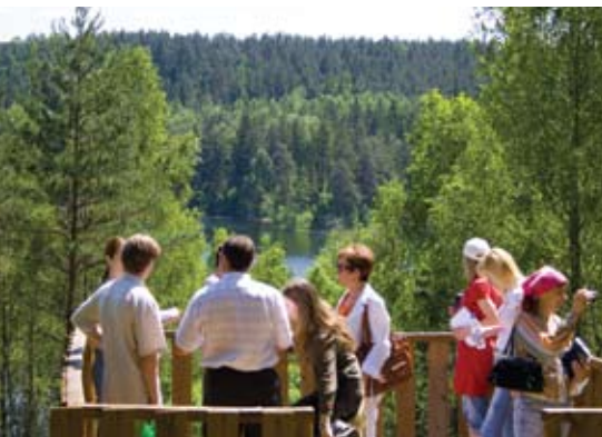
Национальный парк «Нарочанский». Увлечения как водные так и пешие экскурсии

на которого любили охотиться еще короли и магнаты Великого Княжества Литовского.