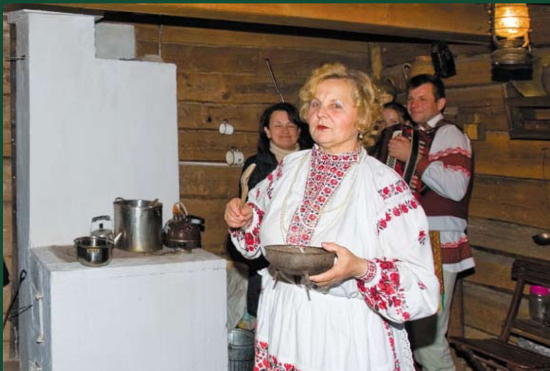
Гостеприимные хозяйки усадеб радужно принимают гостей

Приехав в агроусадьбу, можно дни напролет валяться в высокой траве, наслаждаясь тишиной и покоем, а можно до отказа заполнить свое время активным отдыхом. В одних усадьбах гостям предлагают катание на лодке или катере, в других — велоэкскурсии к историческим местам, в третьих — конные прогулки. Цокот копыт по тенистой дорожке старого парка, плавное покачивание брички и теплое дыхание лошади, осторожно берущей кусочек сахара с ладони, живо вернут вас в романтику прошлых веков. А, взяв всего несколько уроков верховой езды, позже вы сможете удивить друзей новым умением.