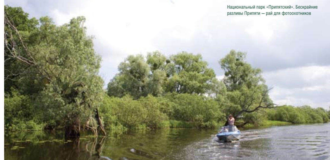
Национальный парк «Припятский». Бескрайние разливы Припяти — рай для фотоохотников