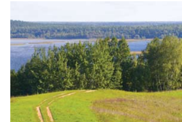
Национальный парк «Браславские озера». Вид с горы «Маяк»