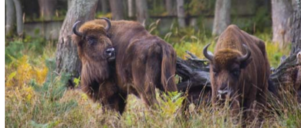
Зубры в Беловежской пуще

Кстати, в последние несколько лет в белорусском агротуризме появилось особое направление — туризм исторический. Путешественникам предлагают посетить отреставрированные старинные усадьбы. Но не надейтесь найти здесь застывшие музейные экспозиции, это ожившая история, с роскошными королевскими пирами, с инсценировками жарких битв, со старинными танцами и музыкой. Проведя хотя бы день в такой усадьбе, туристы не только получают незабываемые впечатления, но и узнают много нового об истории и традициях Беларуси.