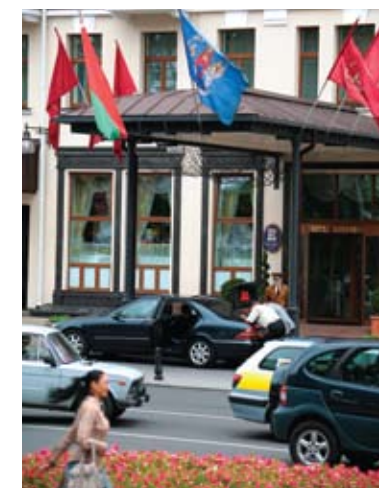
Гостиница «Европа», Минск

Огромные возможности Минск представляет и для отдыха. В городе работает большое количество кинотеатров, оборудованных по последнему слову техники, где показывают самые последние мировые премьеры, в том числе в формате 3D. На престижных мировых конкурсах не раз занимали призовые места белорусские театральные постановки. Проникновенная игра актеров Национального академического театра имени Янки Купалы, Академического драматического театра имени Максима Горького, Государственного